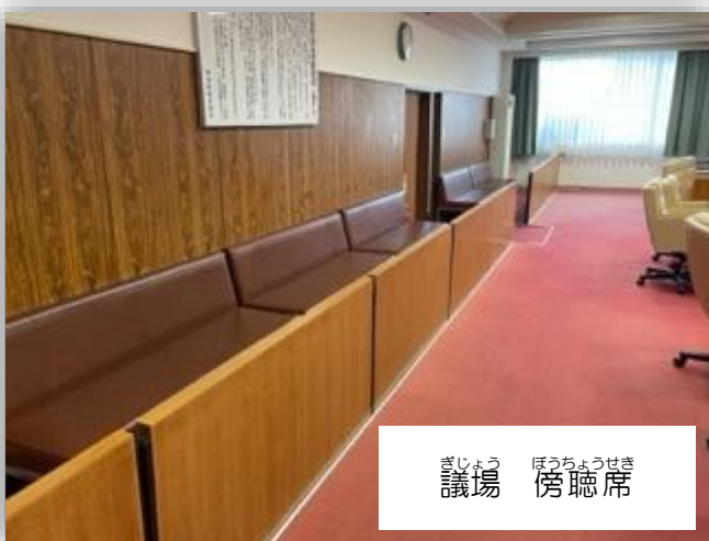
ぎじょう ぼうちょうせき 議場 傍聴席